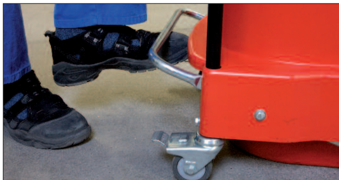
Cea mai ușoară utilizare datorită golirii cu ajutorul pedalei