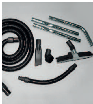
pentru WS 200