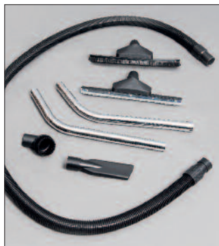
pentru WS 100