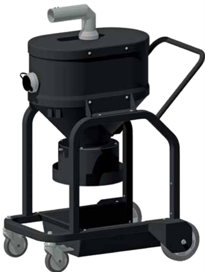
Separator preliminar cu evacuare pentru Longopac®